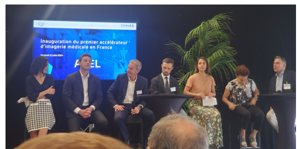
Photo de la tribune lors du 12 juillet 2024 à AVS Thales/ Trixell Moirans en Isère (Sophie Binet, secrétaire confédérale CGT, 3ème personne en partant de la droite)

té coopérative d'intérêt collectif, dont le collège des industriels détient 27 % du capital – « Thales n'est pas majoritaire dans ce collège industriels », nous précise Charles-Antoine Goffin, vice-président des activités Microwave & Imaging Sub-Systems de Thales – tandis que l'union départementale CGT de l'Isère est associée à hauteur de 17 % du capital. Une reconnaissance du travail accompli, pour le moins.